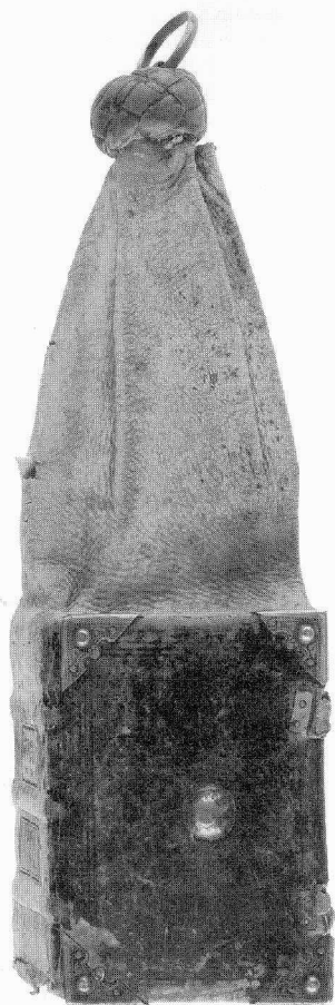
Buidelboek uit Tegernsee, tweede helft vijftiende eeuw (München, Bayerische Staatsbibliothek, Clm 19309, te zien in MÜNCHEN, vgl. WAGNER).

REIDEMEISTER, Johann Superbia und Narziss. Personifikation und Allegorie in Miniaturen mittelalterlicher Handschriften . Turnhout, Brepols, 2006. 229 pp., ill. ISBN 978 2 503 52018 6. € 100.